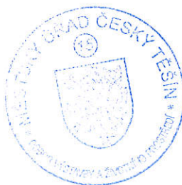
Marcela Krauzová referent stavebního úřadu

Dokončená stavba ve smyslu § 119 odst. 1 stavebního zákona nevyžaduje kolaudační souhlas ani kolaudační rozhodnutí. K tomu je stavebník povinen podle § 152 odst. 1 stavebního zákona zajistit provedení a vyhodnocení zkoušek a měření předepsaných zvláštními právními předpisy.